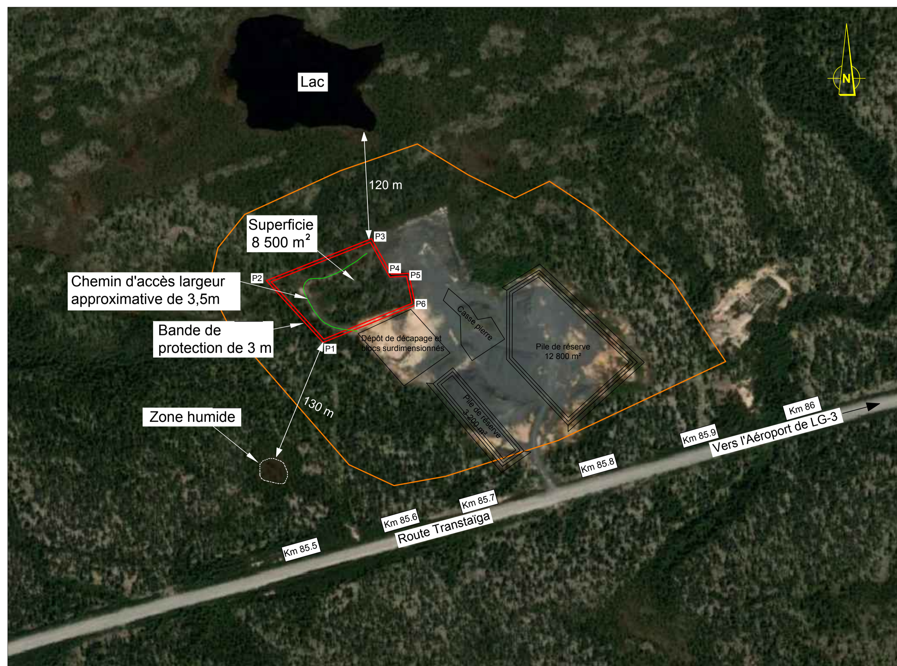
VUE AÉRIENNE ÉCH: 1 : 2 500