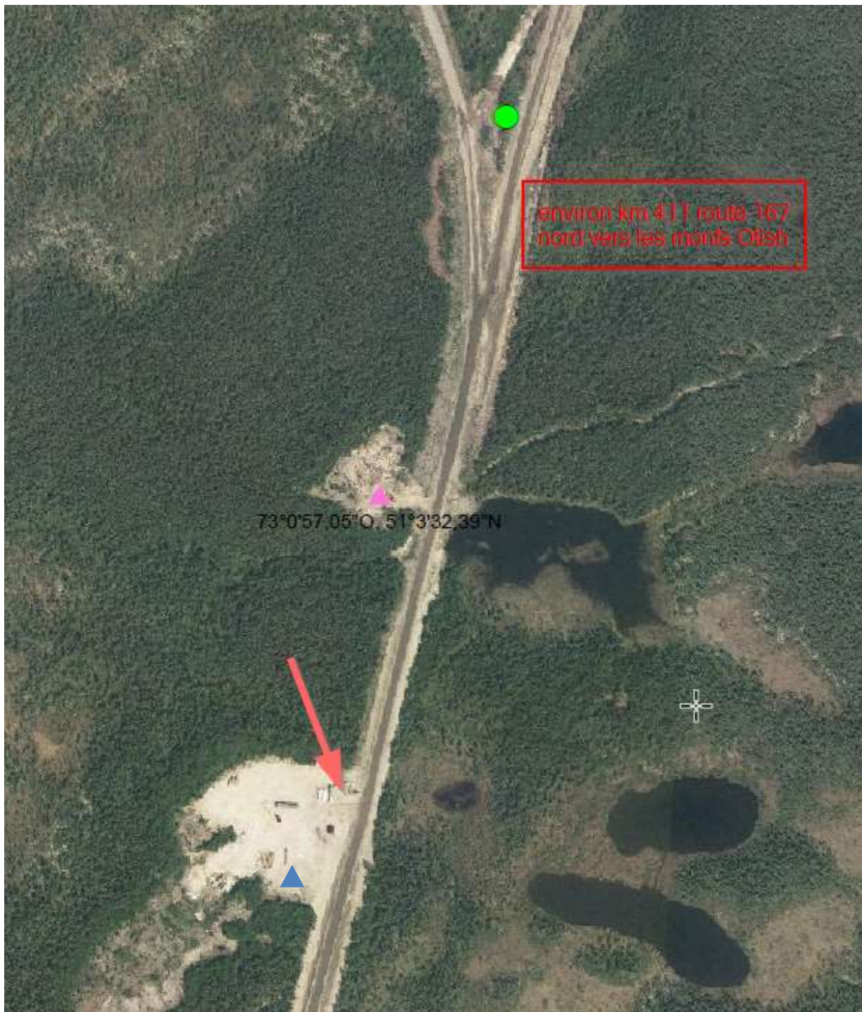
Figure 2 : Localisation du LETI projeté pour la Corporation Nibiischii. Le triangle rose indique l'ancien emplacement, où se trouve la plantation de saules pseudomonticoles. Le triangle bleu indique le nouvel emplacement ciblé. La flèche rouge indique la zone de sols contaminés.